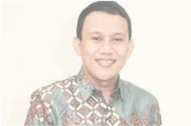
Ketua Dewan Pembina Abdul Kadir Karding, S.Pi., M.Si